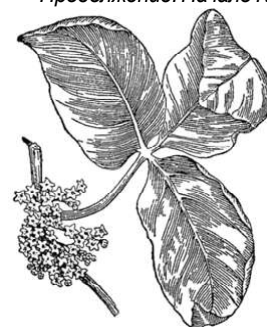
Рис. 75. Ядовитый сумах ( Rhus toxicodendron ).

как она, как и акация, тоже принадлежит к семейству Бобовых. Во время цветения дерево покрывается длинными, свисающими гирляндами крупных цветов красного цвета с ярко-жёлтыми пятнами. Каждый отдельный цветок чрезвычайно красив: на первый взгляд он совсем не похож на мотыльковый цветок (как у гороха), а скорее напоминает какую-нибудь вычурную орхидею. Ещё красивой целая кисть, в которой окрашены не только цветы, но и стебельки и прицветники; общая картина пышно цветущего дерева восхитительна. Немудрено, что художникам хочется украсить амхерстией театральную декорацию, но, повторяю, она абсолютно безвредна. Задохнуться под ветвями амхерстии так же трудно, как под ветвями цветущей яблони или сирени.