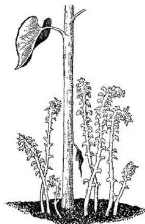
Рис. 86. Зарази́ха на корнях подсолнуха.

Скажем здесь несколько слов о зарази́хах: это пригодится нам при одном из дальнейших рассказов. Зарази́ха представлена несколькими видами: один живет на подсолнухах, другой — на конопле, третий — на полыни, четвертый — на чертополохе и т. д. Все зарази́хи — паразиты. Они не умеют добывать себе пишу сами, они могут питаться только чужими соками.