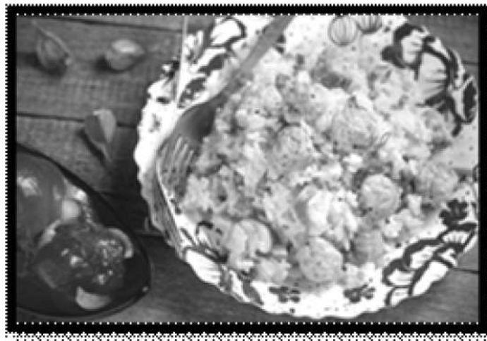
Рис круглый - 320 грамм; Куриный фарш - 230 грамм; Лук репчатый - 1 шт; Морковь - 1 шт; Вода подсоленная - сколько понадобится; Чеснок - 3 зубчика; Куркума - 0,3 ч.л; Чёрный молотый перец - по вкусу; Зира - 2 щепотки; Кориандр - 2 щепотки; Растительное масло - 120 мл; Соль - по вкусу. Время приготовления: 1 час Плов На 5 человек 327 кКал на 100 г Хранить в холодильнике