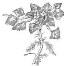
Рис. 97. Чилим, или водяной орех (Trapa natans).

Как замечательно приспособлен чилим к своей жизни в воде! — думалось мне. Такая же мысль, вероятно, приходит всякому, впервые знакомящемуся с этим любопытным растением; но более верный и строгий суд природы говорит иное. В настоящую эпоху чилим, очевидно, недостаточно хорошо приспособлен к жизни: он — растение, уже начавшее заметно вымирать. Сравнительно недавно он был широко распространен по всей Европе, о чем свидетельствуют уцелевшие орехи на дне разных водоёмов, но живой чилим в Западной Европе встречается теперь лишь в очень немногих местах.