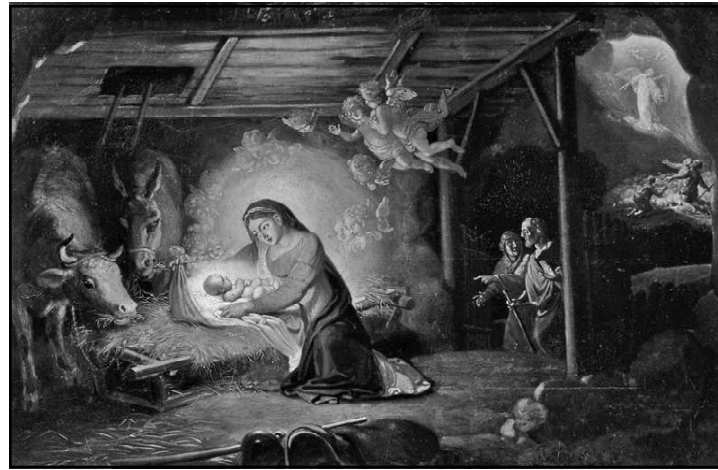
“Рождество христово”. В.Л. Боровиковский

Первыми поклонились Господу простые пастухи. А за ними пришли вавилонские мудрецы — волхвы. Со времен вавилонского плена, когда Навуходоносор увел евреев в рабство, персидские язычники узнали пророчества о Христе: «Восходит звезда от Иякова и восстает жезл от Израиля» (Числа 24:17). Увидев на небе необычно яркую звезду, волхвы поняли, что пророчество совершилось, и