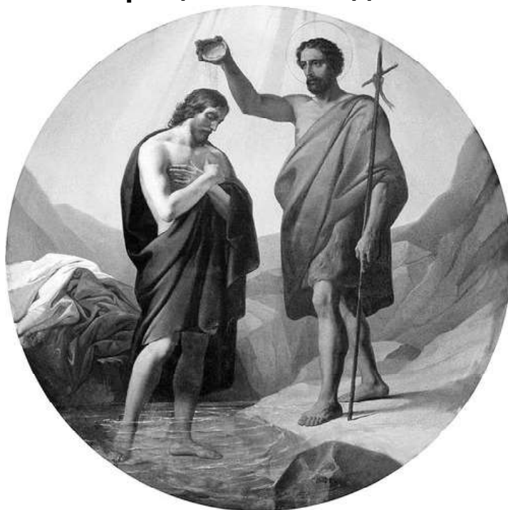
Крещение Христа. Шамшин Петр Михайлович. 1848 г.

взлзал (Лк. 4:2). Диавол три раза подступал ко Христу и искушал Его, но Спаситель остался крепок и отринул лукавого (так называют диавола).