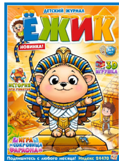
Детские развлекательные журналы