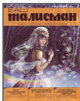
Журнал Ваш талисман