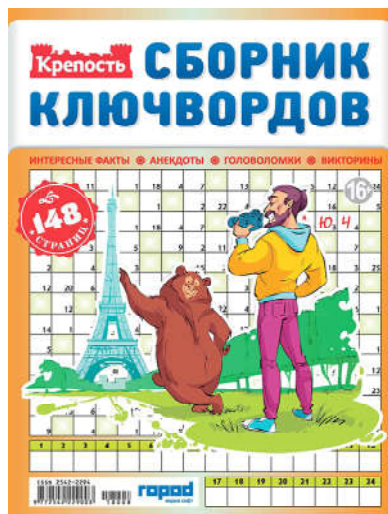
Сборники Ключвордов/ Кейвордов