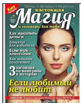
Журнал Магия для тебя