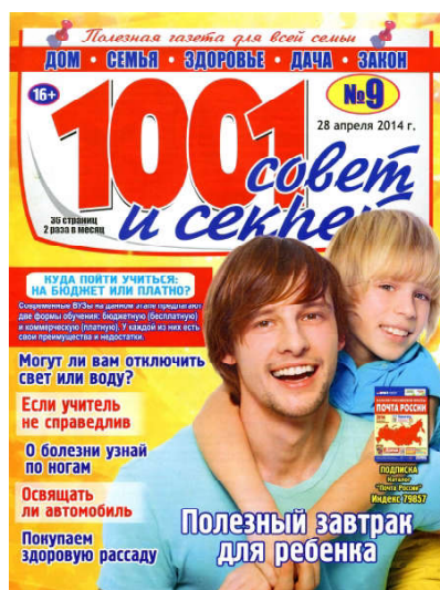
Журналы с Советами