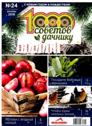
Журналы о Садоводстве