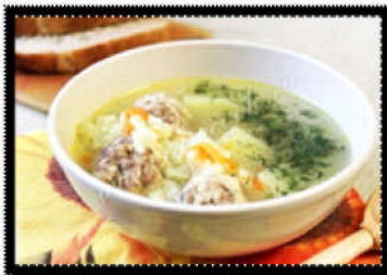
Рис - 1 стакан; Вода - 1,5-2 л; Мясной фарш - 0,6 кг; Картофель - 3-4 штуки; Морковь - 1 штука; Лук - 1-2 головки; Карри или куркума - 1 щепотка; Соль, перец и зелень по вкусу; Растительное масло для жарки. Калорийность 162 кКал Время приготовления 35 мин.