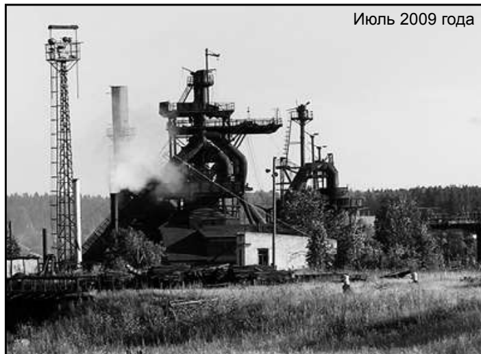
Июль 2009 года

Но пришли лихие 90-е годы, произошли изменения в государстве, связанные с перемной форм собственности, утверждение рыночных отношений. Утверждалось, что рынок, урегулирует все сложные производственные вопросы. Ваучерная приватизация, обещавшая по две «Волги» за ваучер, опьянила головы людей, привыкших верить власти. «Волги», даже одной, никто не получил, а благодаря обману ваучеры уходили за бесценок, завод попал в частные