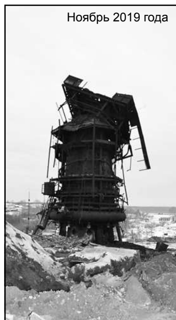
Ноябрь 2019 года

Да, обман 90-х удался, под словесный треп люди потеряли многое, но обман не прошел бесследно, потеряна вера во власть. Сейчас, когда химкомбинат переживает сложные времена, уже нет веры, что все нормализуется, хотя губернатор говорит о больших перспективах этого предприятия - потеряна у людей вера. Как бы не закрылась еще одна заводская проходная.