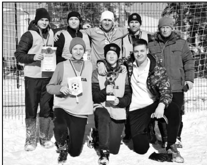
Победитель команда ФК Орион

Авторы: Демерджи-Оглы Владислав Валерьевич, Н. В. Байдосова