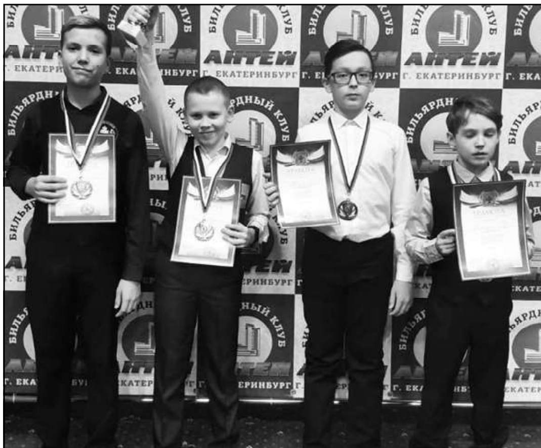
Автор статьи и фото: Мясников Евгений Викторович

Савелий получил возможность представлять Свердловскую область в Первенстве России по бильярдному спорту, которое пройдет 03-11 января 2021 года в г.Екатеринбург.